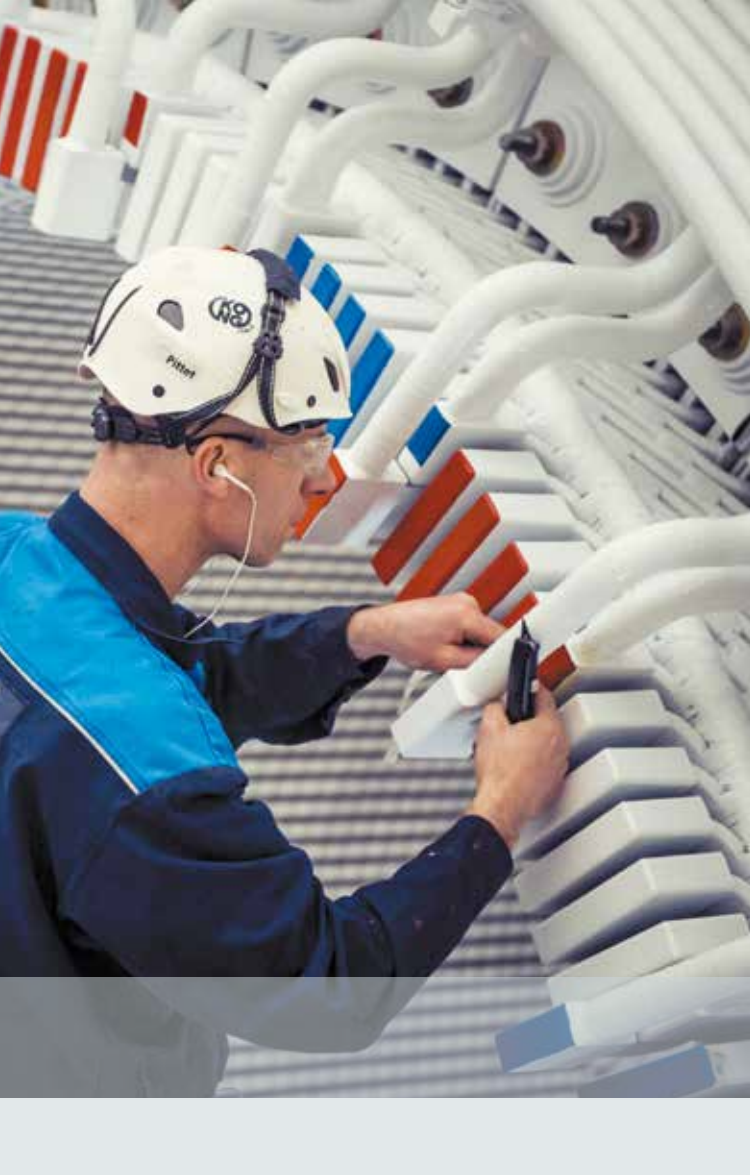
Nous disposons d'une équipe de montage Wir verfügen über ein Montageteam.

Die SFMCP hat uns 2011 im Rahmen der Rehabilitation der Gruppen 3 und 4 des Werks von Chancy-Pougny mit der Ausführung des Loses „Steuerung“ betraut. Die Arbeiten an der Gruppe 3 wurden im Mai 2012 abgeschlossen, das heisst, dass die Ingenieure der Telematik 4 Monate an Ort und Stelle waren. Die Inbetriebnahmephase der Gruppe 4 sind im Sommer 2014 angelaufen.