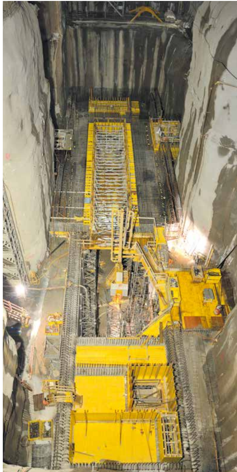
Installation du réseau de mise à terre pour FMHL+ Installation des Erdungsnetzes für FMHL+

Der Betrieb der Anlagen erfolgte 2014 unter guten Bedingungen und ohne grösseren Zwischenfall. Wegen des Rückgangs unseres Tätigkeitsvolumens mussten wir unseren Personalstand anpassen, was durch natürliche Abgänge erreicht werden konnte. Die Revisionen der Produktionsanlagen mit Speicherbecken wurden während geplanten Betriebsunterbrüchen vorgenommen. Bei den Pump- und Laufkraftwerken wurden die Arbeiten unter Berücksichtigung der Wasserzuflüsse oder während geplanten Betriebsunterbrüchen durchgeführt.